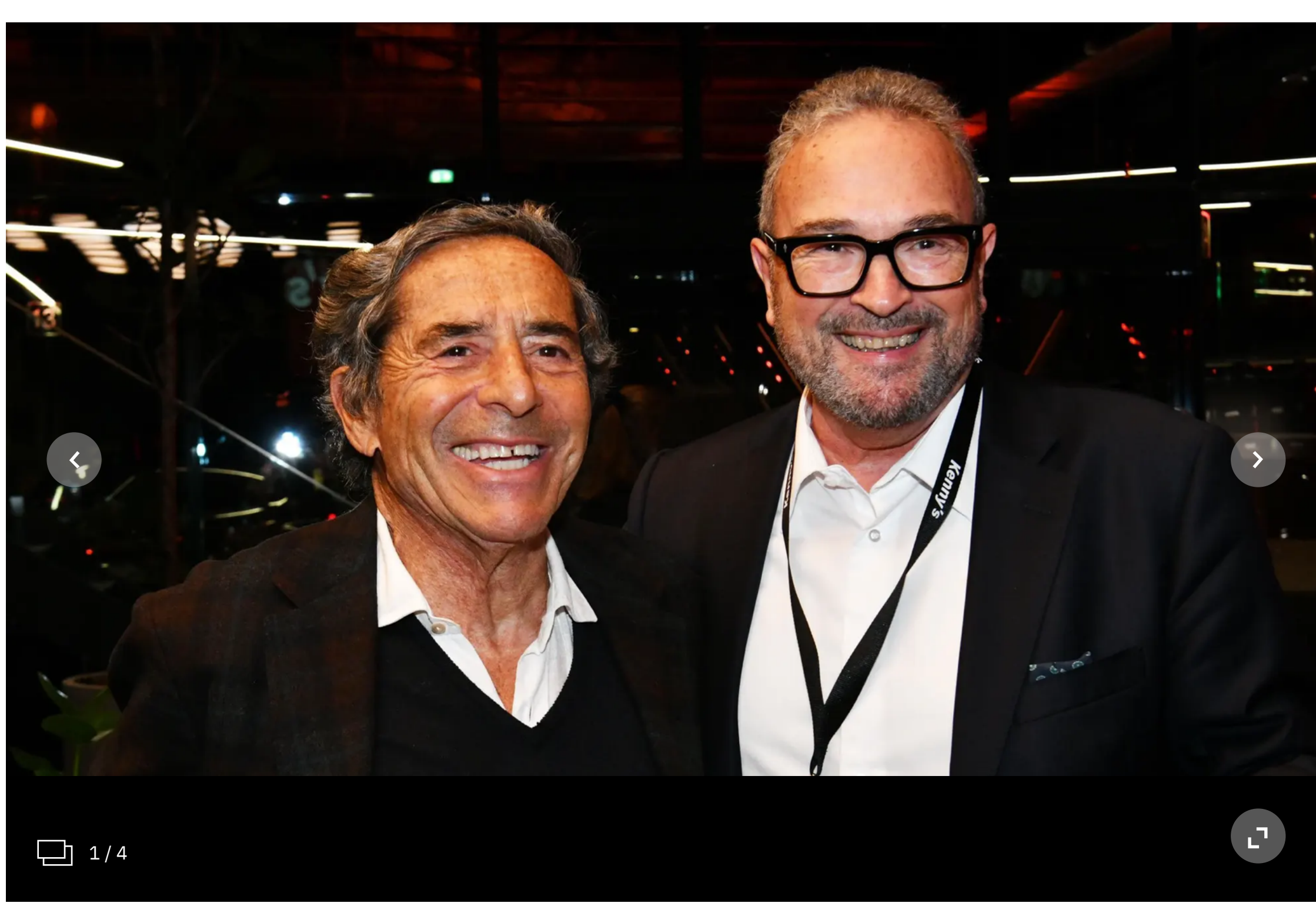
Auch Roger Schawinski machte seine Aufwartung.