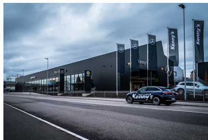
Das neue Auto-Center in Dietlikon.